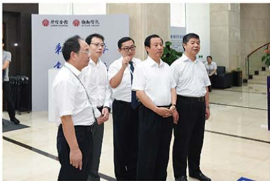
▲ 许达哲省长考察现场

许达哲首先考察了集团旗下湖南信托财富管理中心，与企业一线职工交流，向大家了解日常业务工作、企业发展等情况。