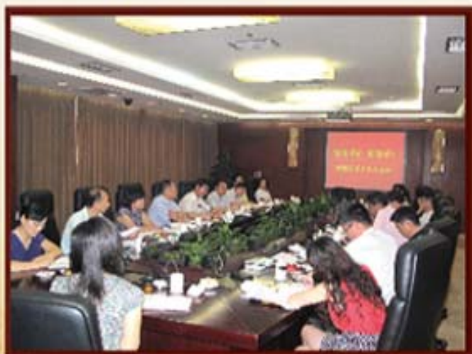
2011年8月12日，湖南银监局、省财政厅在湖南信托召开现场办公会。