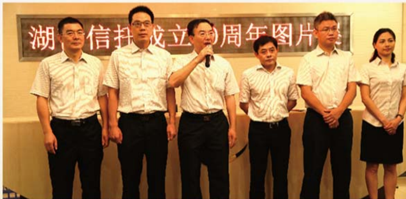
“三十而立，共创辉煌”湖南信托成立30周年图片展开展仪式

湖南信托成立30周年图片展，以图文并茂的形式回顾湖南信托的发展历程，以隆重节俭的方式纪念祝贺湖南信托成立30周年，对于宣传湖南信托，扩大社会影响，增强全体员工的凝聚力、向心力和集体荣誉感，促进持续稳健发展具有重要的意义。