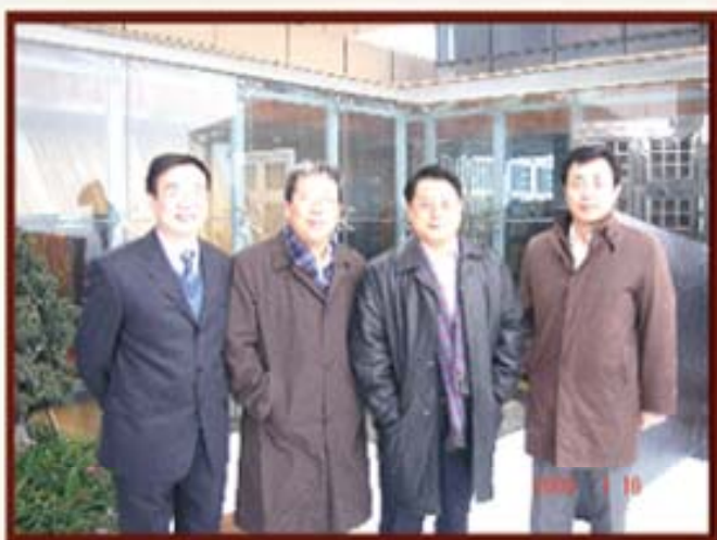
2008年1月16日，财政部李勇副部长（右二）视察湖南信托。