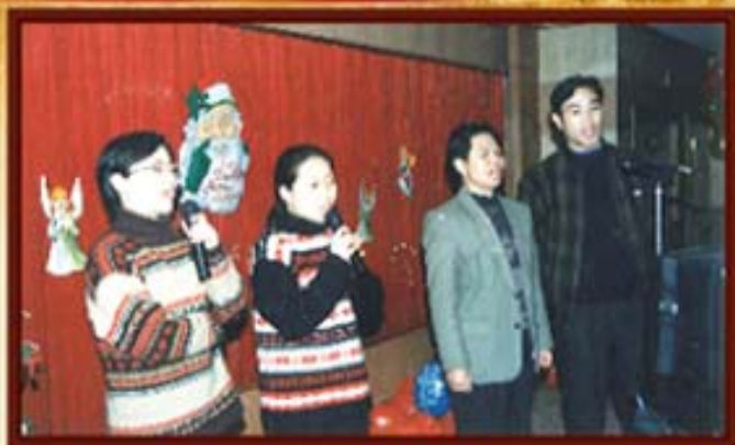
1998年，湖南信托员工欢度圣诞。