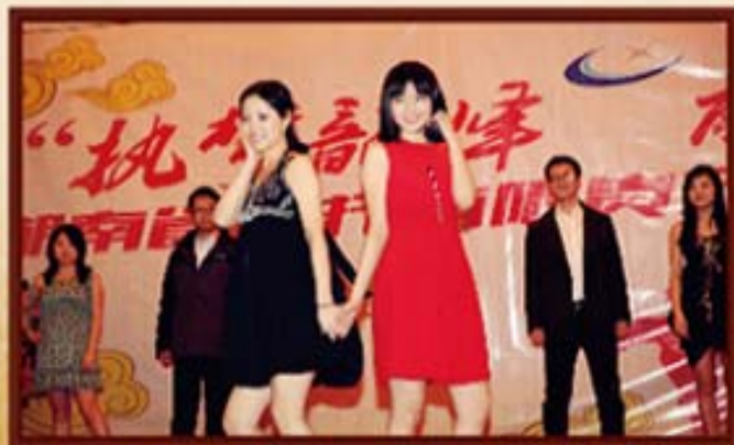
2014年1月3日，湖南信托舞蹈兴趣小组风采展示。