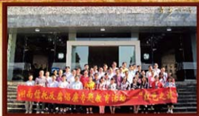
2009年5月8日，湖南信托赴井冈山开展反腐倡廉红色教育之旅活动。