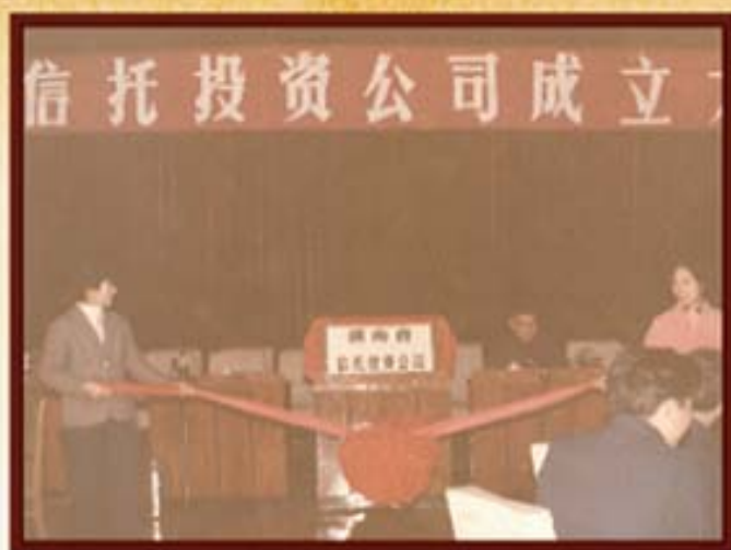
1985年2月26日，湖南信托成立。