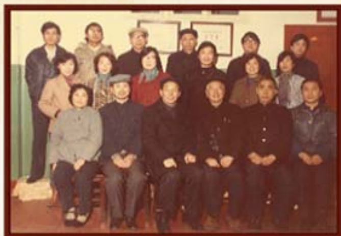
湖南信托部分老员工合影。