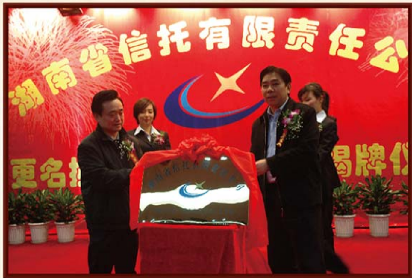
2008年11月28日,省委常委、副省长徐宪平(右),省人大常委会副主任陈叔红(左)在湖南信托换领新金融牌照后,为湖南信托揭牌。

7.2008年10月23日,中国银行业监督管理委员会以《中国银监会关于湖南省信托投资有限责任公司变更公司名称和业务范围的批复》(银监复[2008]429号),批准同意湖南信托获得新的金融许可证,并更名为湖南省信托有限责任公司。