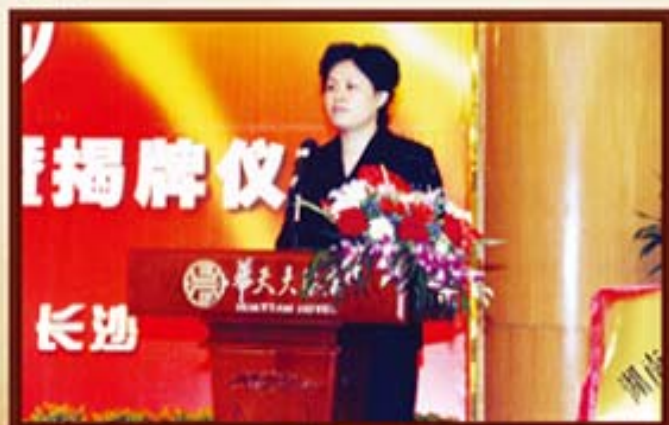
2003年4月9日，副省长甘霖出席湖南信托重新登记揭牌仪式并讲话。