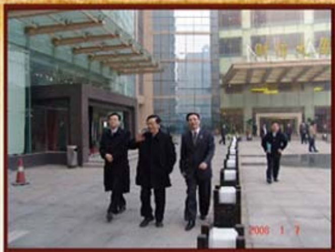
2008年1月7日，财政部长谢旭人（中）。