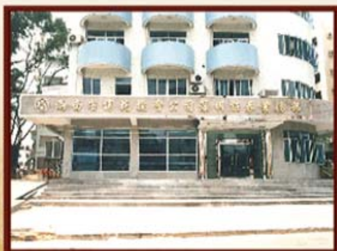
1994年6月2日，湖南信托深圳证券业务部成立。