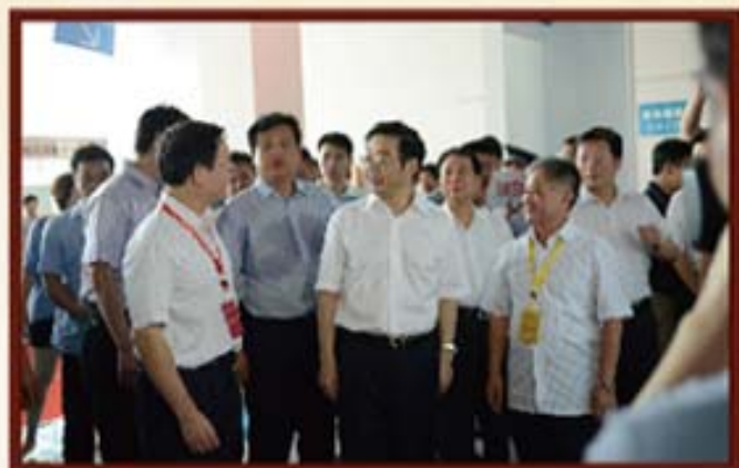
2011年9月17日，湖南省委书记周强（中）视察金博会湖南信托展厅，右为财信控股总裁胡小龙。