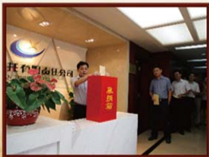
2014年9月28日，湖南信托员工为公益信托计划捐款。