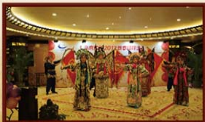
2013年1月26日，湖南信托员工表彰会上文艺表演。