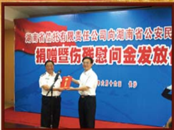
2011年6月16日，湖南信托向湖南省公安民警基金会捐赠200万。