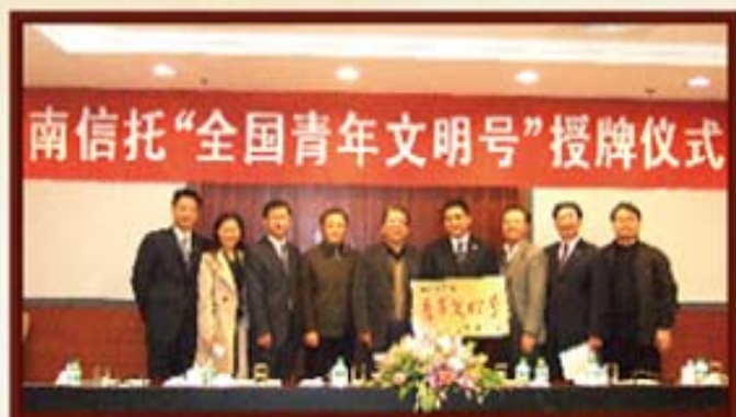
2008年11月28日，湖南信托被授予全国青年文明号。

2006年8月8日，湖南信托推出的“封闭式基金投资集合资金信托计划”荣获最佳证券信托计划。