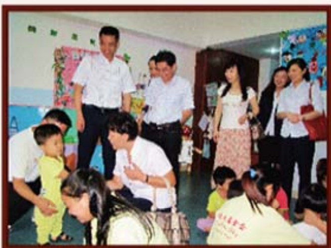
2011年9月8日，湖南信托慰问儿童福利院。