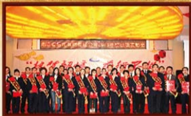
2014年1月3日，湖南信托总结表彰会。