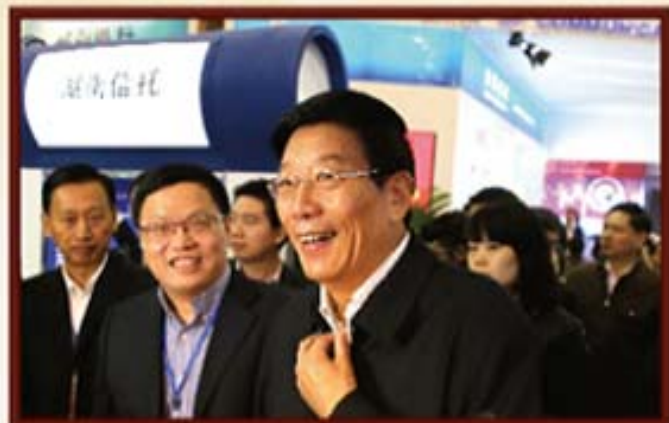
2013年9月19日，湖南省委书记徐守盛（右）视察金博会湖南信托展厅，中为财信控股董事长王红舟。