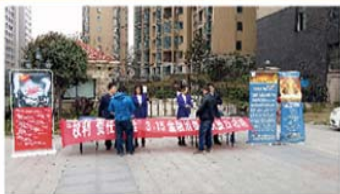
小区宣传展台 网点宣传展台

本次“3.15 金融消费者权益日”活动的开展，进一步强化了消费者的金融素质，增强了消费者的风险防范能力，活动取得了良好的宣传效果。