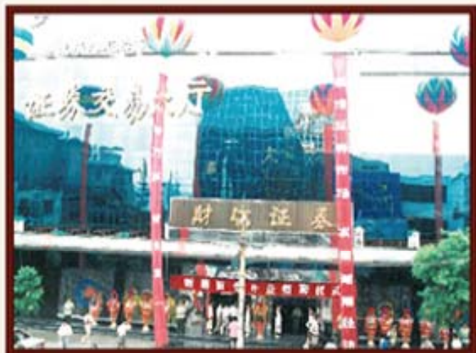
1993年8月8日，湖南信托证券交易大厅开业。