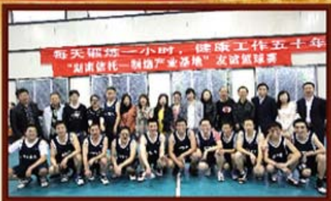
2013年4月19日，湖南信托与浏阳制造产业基地开展友谊篮球赛。