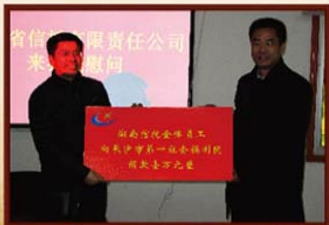
2011年1月21日，湖南信托全体员工慰问长沙市第一社会福利院。