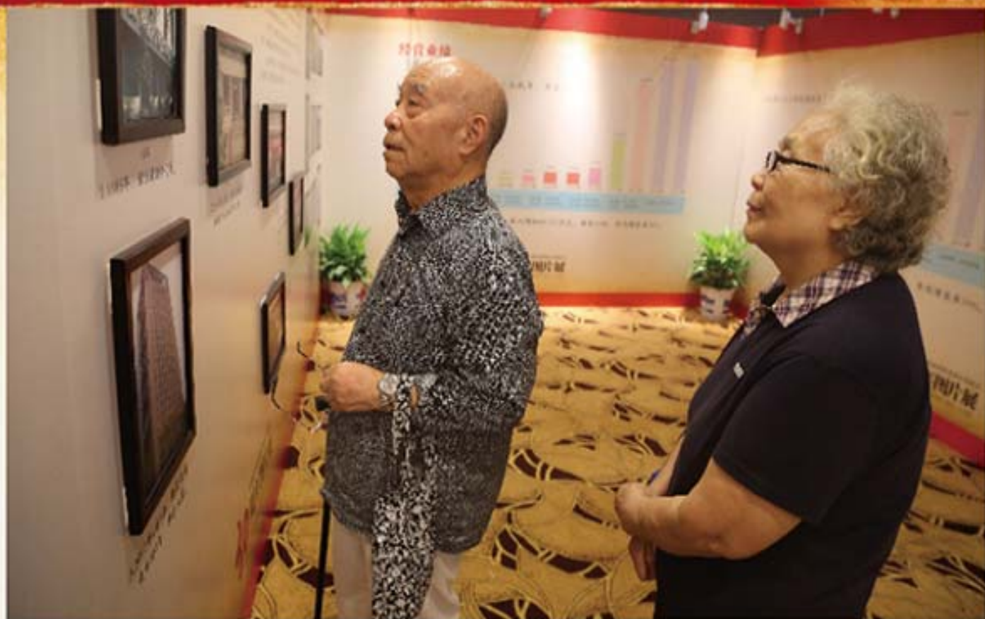
老同志参观湖南信托成立 30 周年图片展。