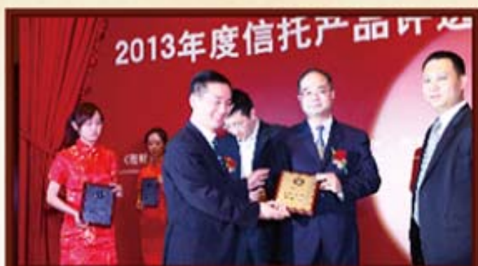
2013年4月19日，湖南信托获“最佳财富管理公司”荣誉称号。