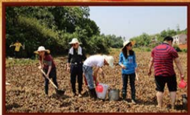
2014年5月1日，湖南信托员工田间劳动。