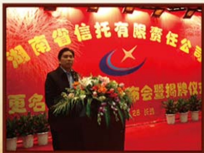
2008年11月28日，湖南信托换领新金融牌照后，省委书记、副省长徐宪平在揭牌仪式上致辞。