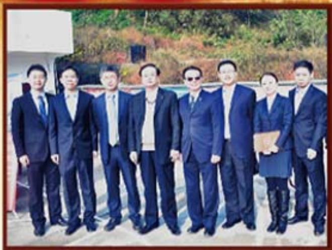
2014年11月18日，李友志副省长（左四）亲切慰问湖南信托工作人员。