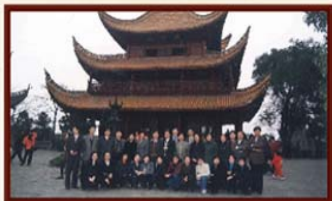
湖南信托员工在岳阳楼合影。