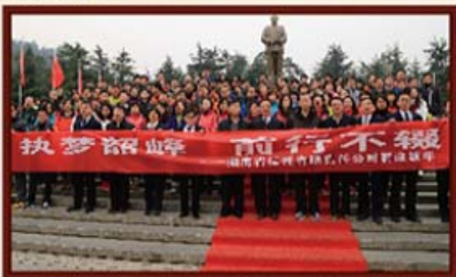
2014年1月3日，湖南信托开展“执梦韶峰，前行不辍”迎新春活动。