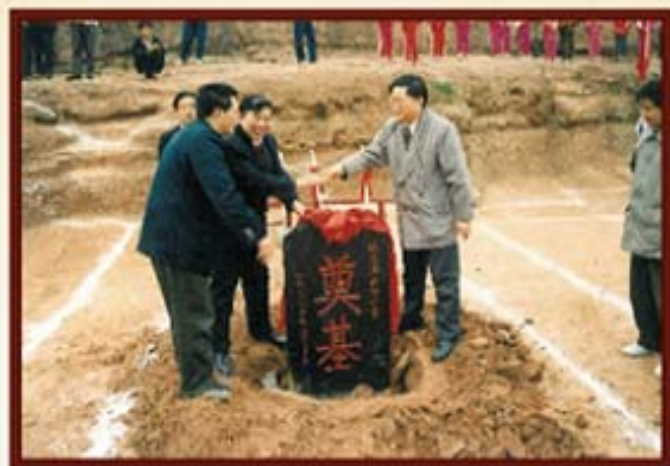
1995年3月1日，湖南信托援建梁家潭希望小学奠基仪式。