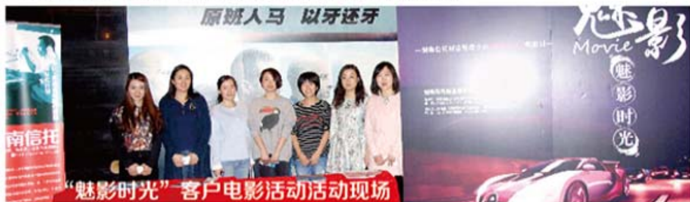
“魅影时光”客户电影活动活动现场

湖南信托财富管理中心自成立以来，一直致力于为客户提供高品质的服务，从开始的服务创新和尝试，到逐步活动品质的提高，活动覆盖范围的扩大，为更多的客户带来了高品质服务，客户服务提升感知明显。通过多次客户活动，逐步搭建了与客户交流沟通的渠道，许多客户与我们成为了朋友，对我司客户服务提出了高度赞赏。