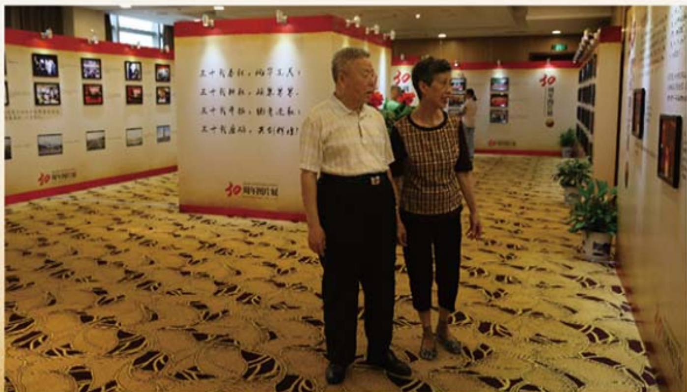
老同志参观湖南信托成立 30 周年图片展。