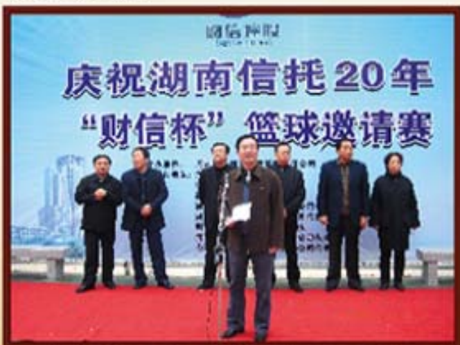
2006年12月6日，湖南信托举办庆祝湖南信托20年篮球赛，省财政厅厅长李友志、副厅长李良田、王新国、胡伟林、总会计师张美西、财政部驻湘专员办杨柱安专员参加开幕式。