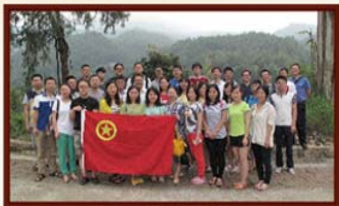
2014年7月，湖南信托首届青年论坛活动。