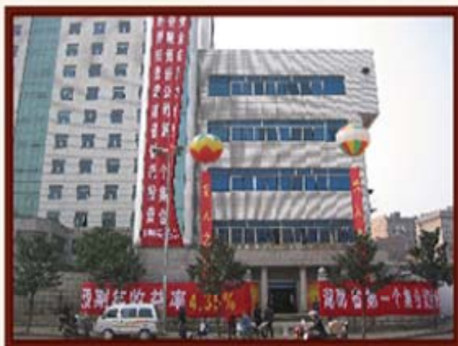
2003年3月26日，湖南信托发售第一个集合资金信托计划“棋林绿洲”。