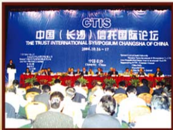
2004年10月6日，湖南信托举办信托国际论坛。