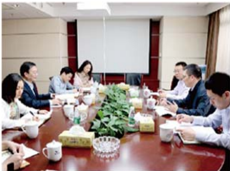
中国信托业协会党委书记、专职副会长（常务）漆艰明（右中）到我司调研

漆艰明书记对湖南信托长期以来对协会工作的支持表示感谢，对湖南信托提出的建议和请求逐一做了回应和解答，表示协会将进一步加强会员服务、舆情管理、监管法规学习等方面的工作，结合信托行业创新发展需要，加强与信托公司的交流与沟通，更好的发挥桥梁纽带作用，积极稳妥地推进各项工作，共同推进信托业转型发展。