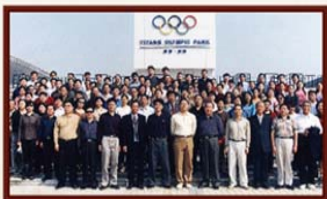
2002年，湖南信托员工在益阳。