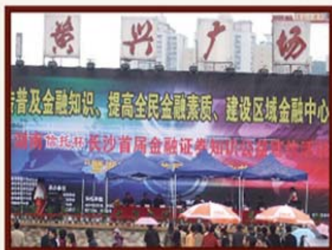
2006年11月25日，举办“湖南信托杯”长沙首届金融证券知识公益宣传活动。