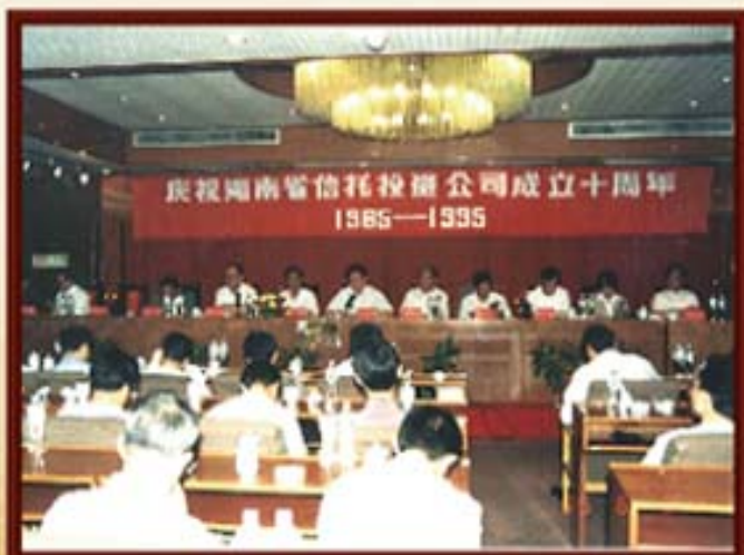
1995年6月8日，湖南信托召开成立十周年庆祝大会。