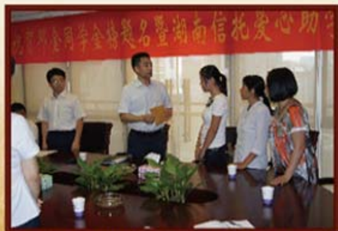
2010年8月18日，湖南信托组织点对点助学捐款活动。