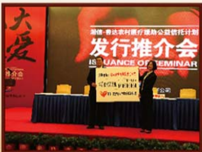
2014年9月26日，湖南信托为公益信托计划捐款500万元。