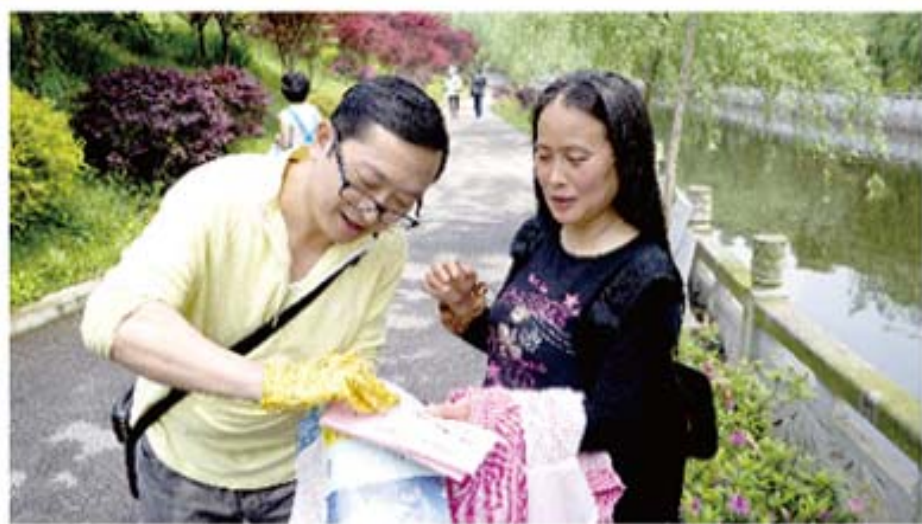
□客户踏春寻宝活动中

4月25日，趁着春色正好、阳光明媚，我司邀请了60余名高端客户及其家属参加湘信财富举办的“约会春天·赏花寻锦”客户踏春活动，带领客户一同领略国家4A级景区湘潭盘龙大观园的秀丽风光，享受寻宝踏青的别样乐趣。