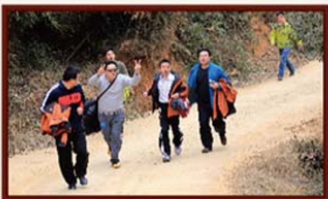
2014年1月3日，湖南信托全体员工登韶峰比赛。