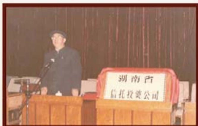
1985年2月26日，湖南省副省长周政在湖南信托成立时讲话。