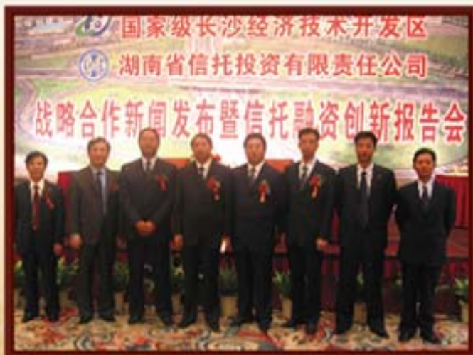
2004年10月9日，湖南信托与长沙经开区举行信托融资创新报告会。