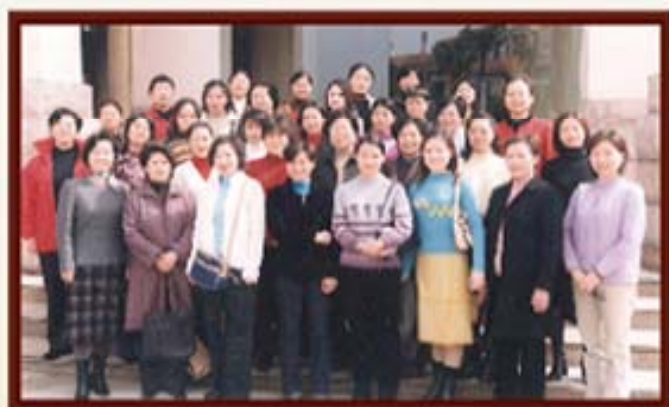
2003年，“三八妇女节”女职工合影。