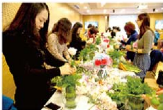
『如花女人雅致人生』活动现场

本次活动进一步提高了我司形象与品牌影响力，促进和加深了与客户之间的情谊。财富管理中心有信心在2015年为更多的客户带来高品质服务。通过加深对客户关注，倾听客户的声音，满足客户的需求，来回馈广大客户对湖南信托始终如一的支持与厚爱。