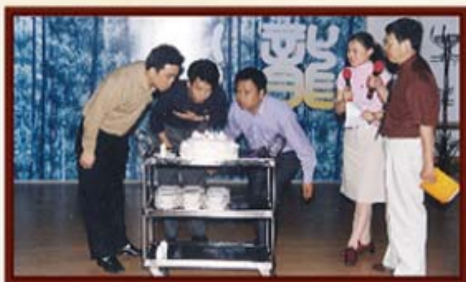
湖南信托员工生日会。