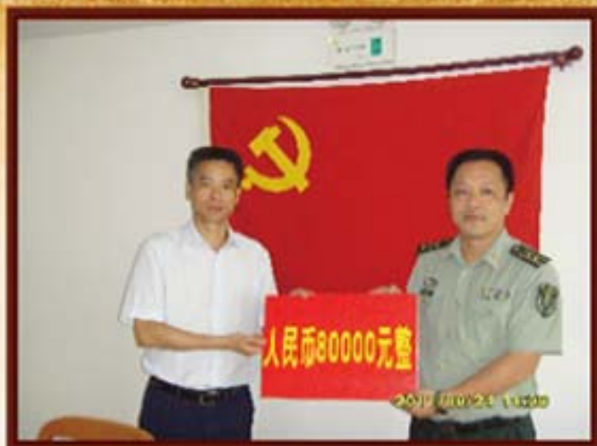
2011年8月24日，湖南信托与长沙市警备司令部开展军民共建活动。