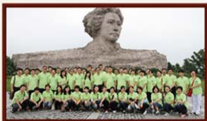
2012年6月6日，湖南信托组织参观橘子洲头“两型社会”展示馆。