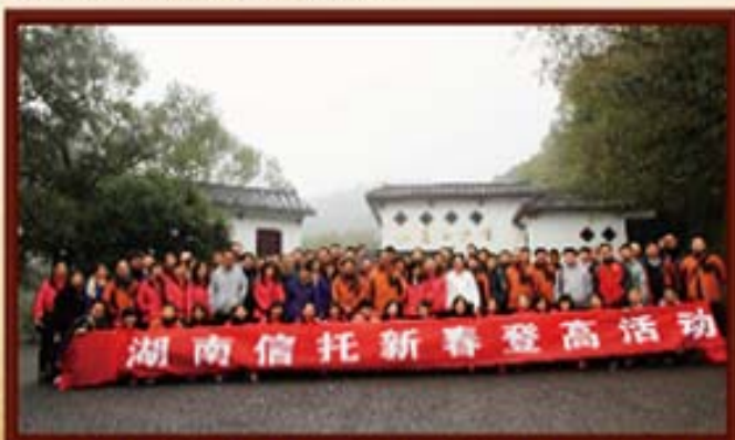
2013年2月27日，湖南信托开展2013年新春登高活动。