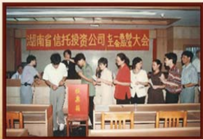
1997年7月14日，湖南信托工会成立投票现场。