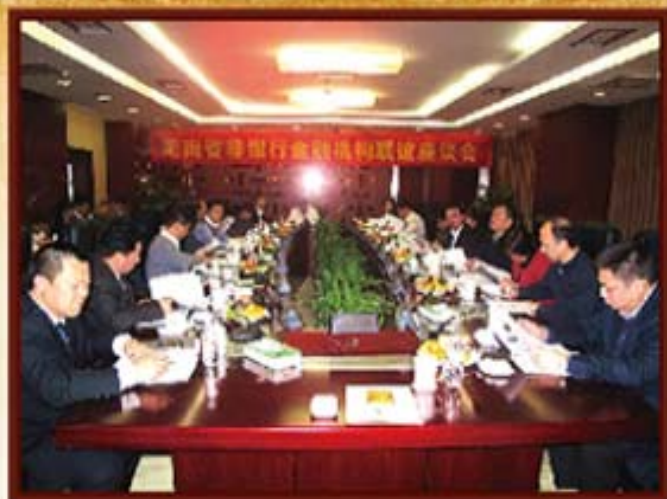
2011年3月14日，湖南信托召开首次湖南省非银行金融机构座谈会。