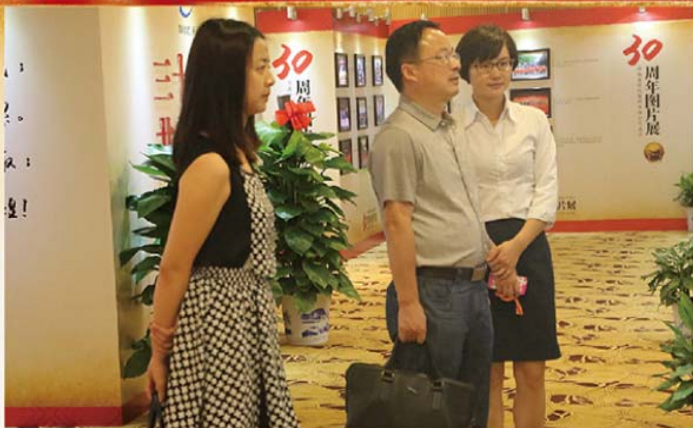
公司客户参观湖南信托成立 30 周年图片展。