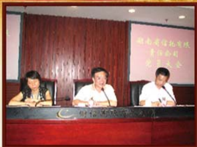
2010年7月16日，湖南信托党员大会，选举党总支委员会。