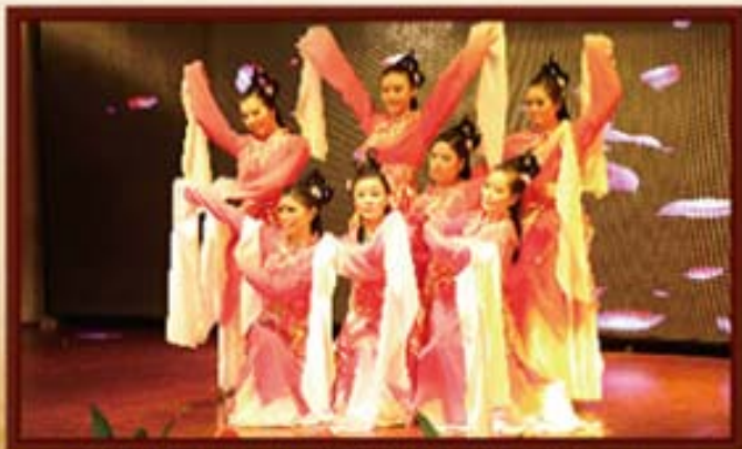
2015年2月6日，湖南信托员工文艺表演。