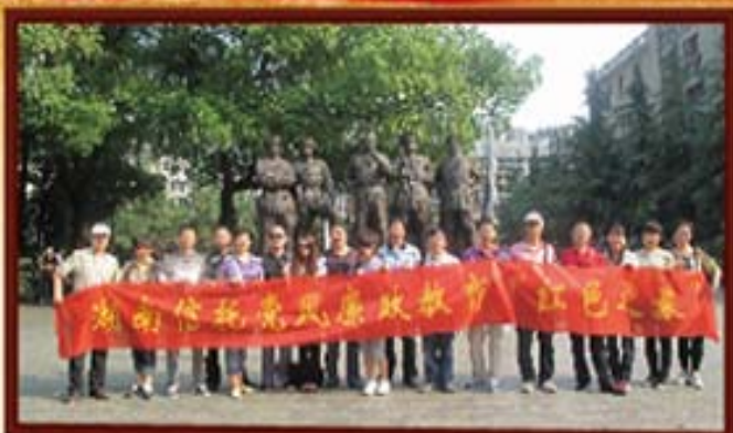
2011年，湖南信托赴庐山开展反腐倡廉红色教育之旅活动。