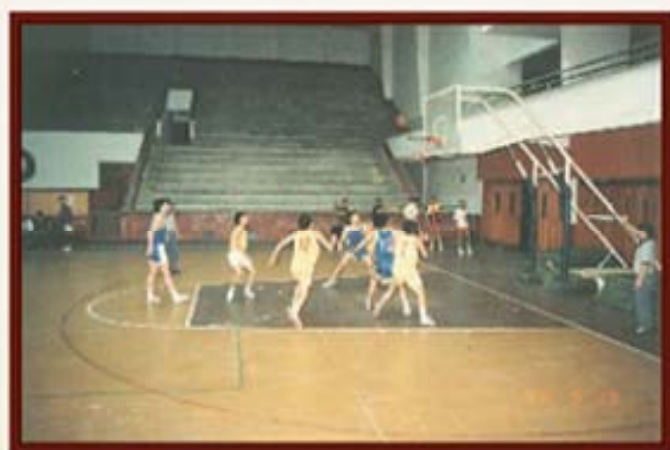
1994年9月13日，湖南信托篮球队参加比赛。