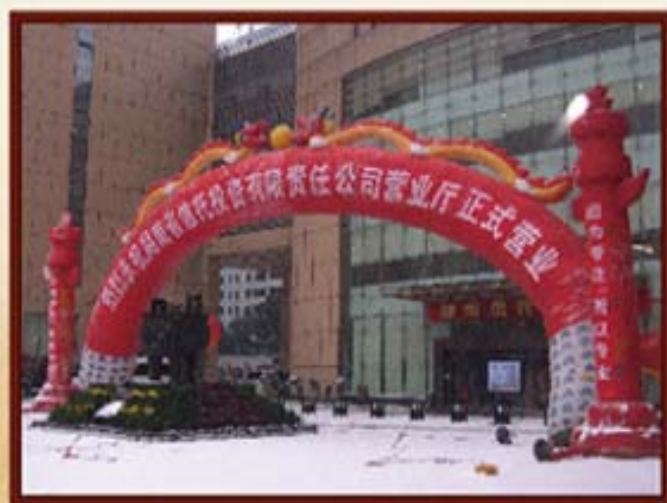
2008年1月15日，湖南信托营业厅正式营业。