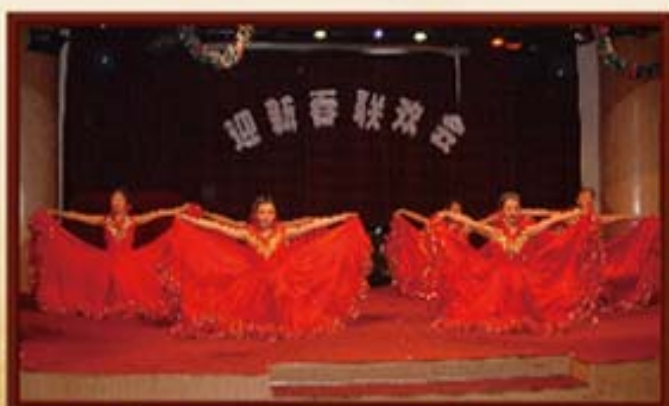
2006年，湖南信托开展春节联欢会。