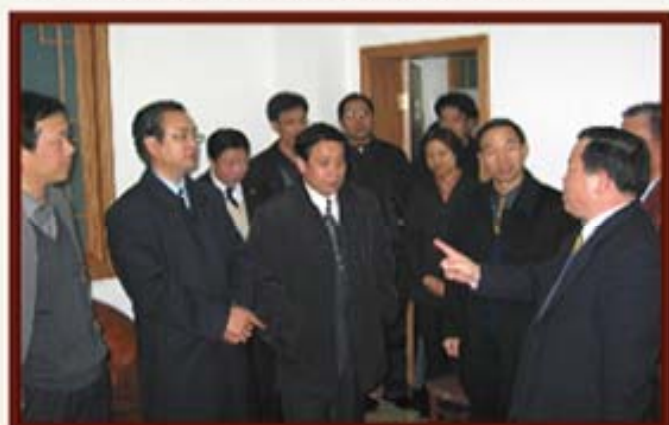
2002年12月31日，湖南省长周伯华（右）视察湖南信托。