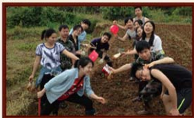
2014年5月9日，湖南信托组织新员工培训田间劳动。