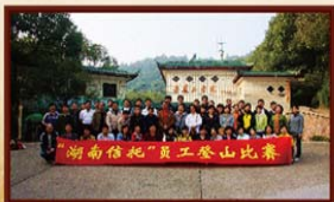
2008年，湖南信托开展岳麓山登高比赛。