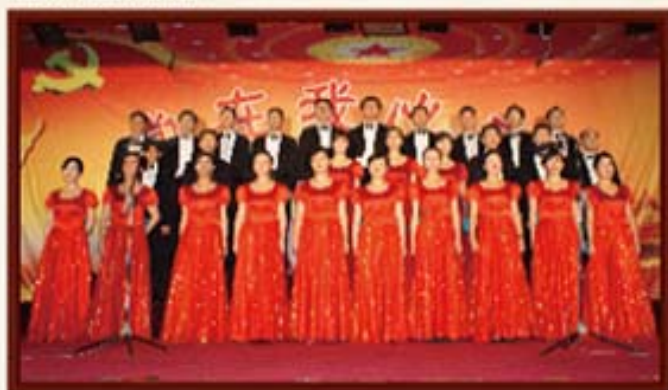
2011年6月28日，湖南信托参加建党90周年红歌会。