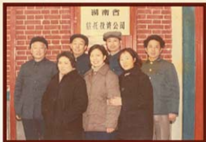
湖南信托成立时工作人员合影。