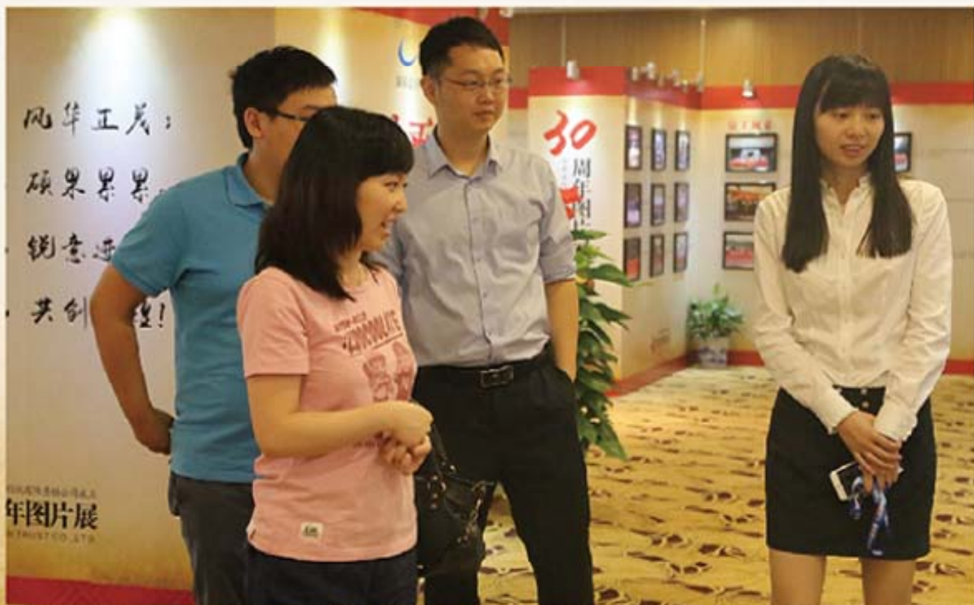
公司客户参观湖南信托成立 30 周年图片展。