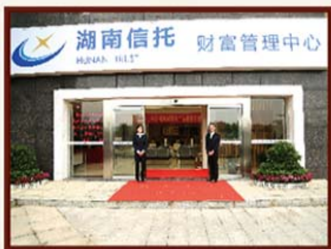
2014年3月18日，湖南信托财富管理中心开业。