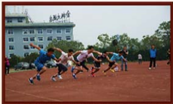
2014年11月15日，第三届员工运动会男子100米。