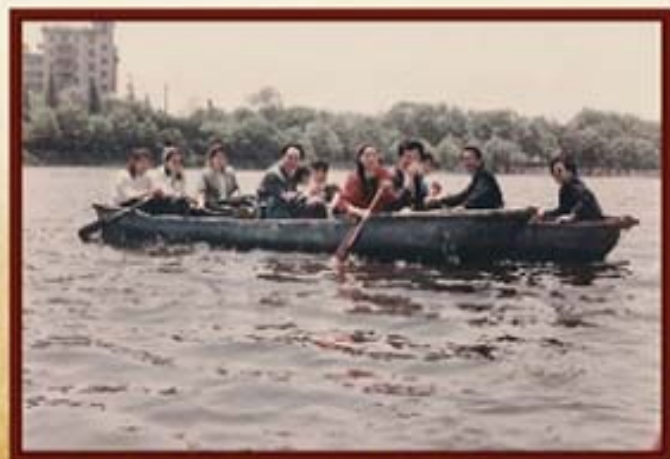
1995年5月，湖南信托职工组织游园活动。