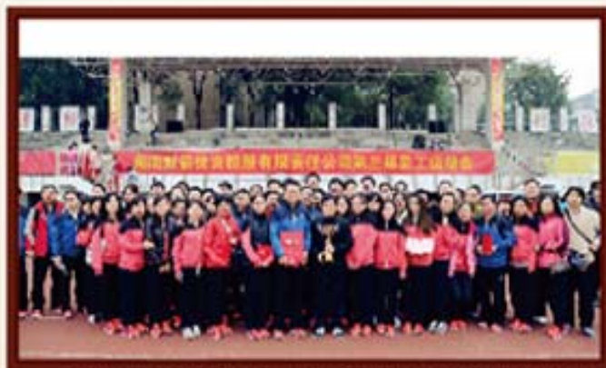
2014年11月15日，湖南信托参加湖南财信第三届员工运动会并获得了团体冠军。