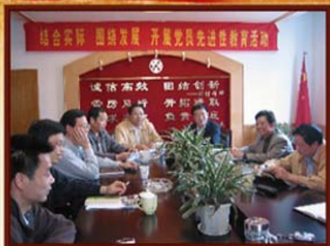
2005年4月4日，湖南信托开展党员先进性教育活动。