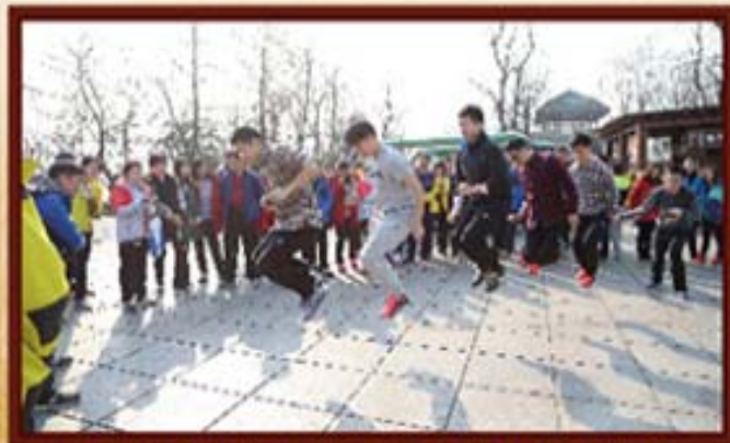
2015年1月4日，湖南信托员工岳麓山跳绳比赛。