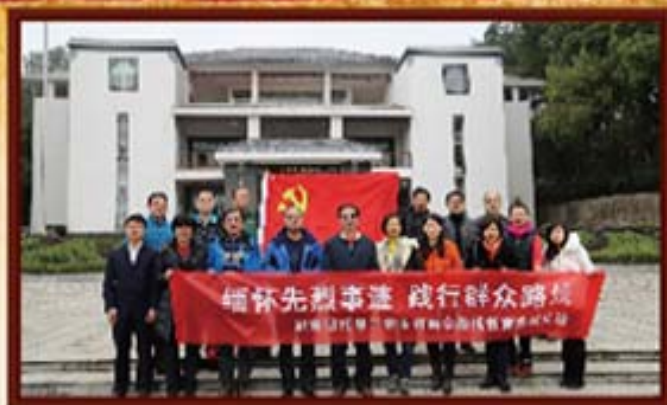
2014年3月21日，湖南信托第二支部开展群众路线活动。