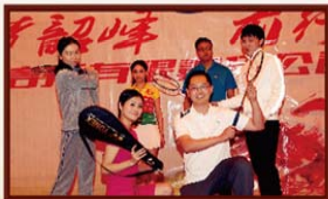
2014年1月3日，湖南信托羽毛球兴趣小组风采展示。