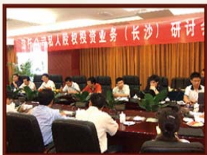
2007年7月7日，湖南信托召开信托行业私人股权投资业务研讨会。