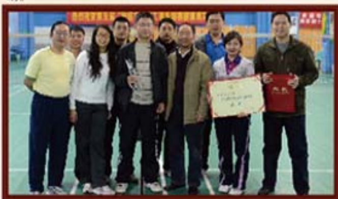
2011年12月2日，湖南信托二支部在财信控股第五届员工羽毛球团体赛上获得冠军。