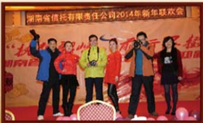
2014年1月3日，湖南信托摄影兴趣小组风采展示。