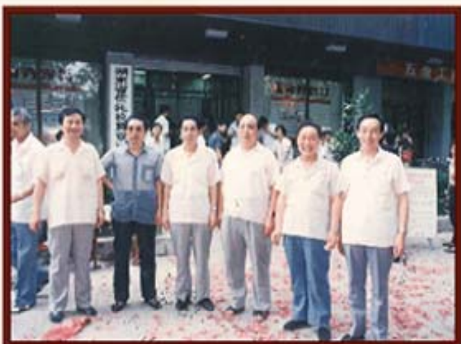
1988年，湖南信托营业部开业，省财政厅厅长霍宝元（左三）、副厅长赵养浩（右二）与省人民银行、建行、工商局领导参加开幕式。