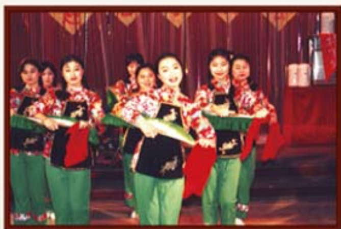
1995年，湖南信托开展春节联欢会。