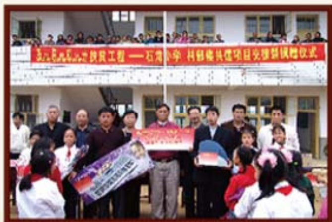
2005年10月18日，湖南信托参与援建的邵阳县石龙小学交付使用。