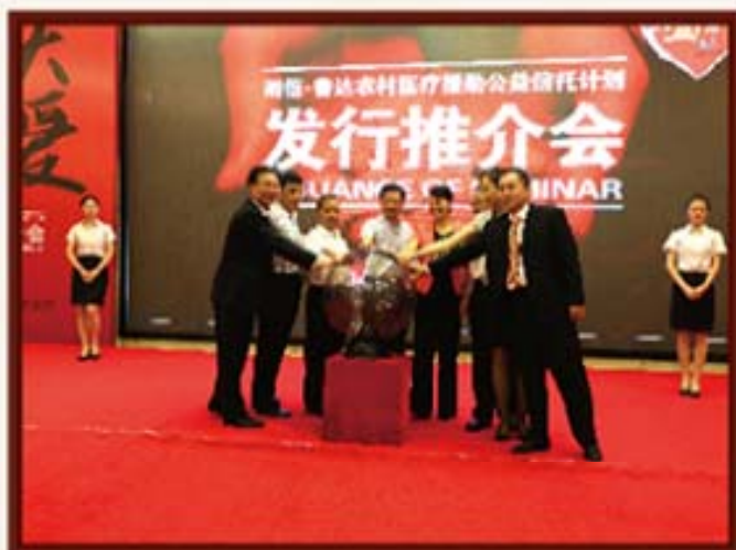
2014年9月26日，湖南信托发行的“湘信·善达农村医疗援助公益信托计划”正式发行。