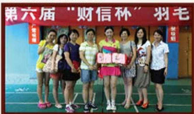
2012年6月20日，湖南信托员工参加第六届“财信杯”羽毛球赛，获得单打、双打冠军。