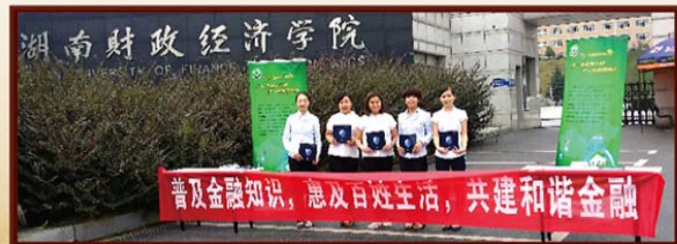
2014年9月，湖南信托开展金融知识服务宣传月活动。