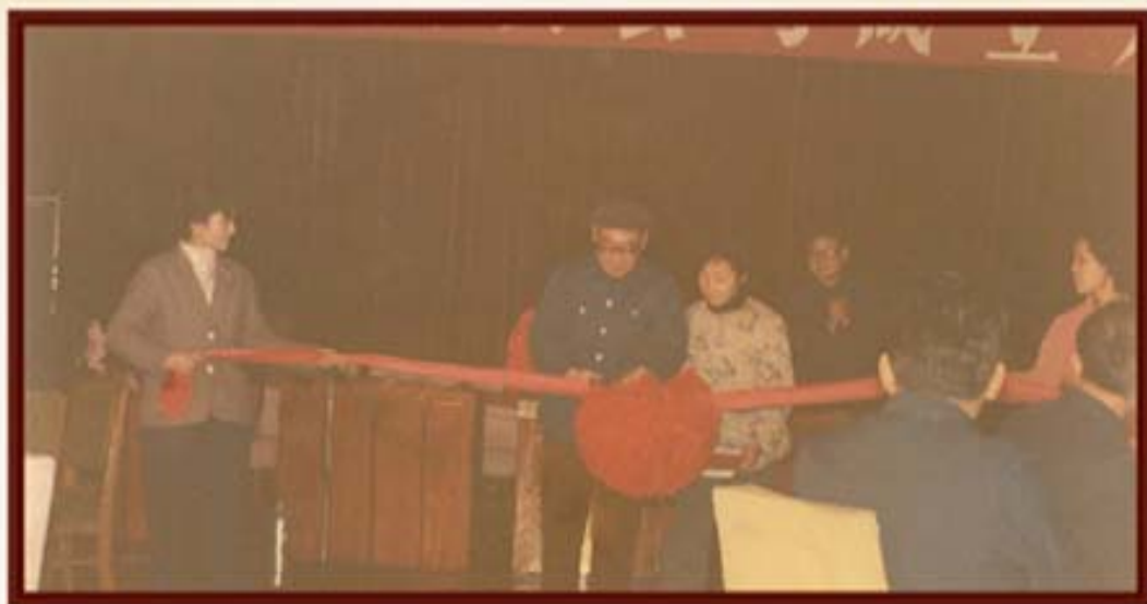
1985年2月26日，湖南省省长刘正为湖南省信托投资公司成立剪彩。

1.1985年2月，经湖南省人民政府办公厅湘政办函[1985]8号及同年5月中国人民银行总行银发字[1985]第99号文件批准，同意成立湖南省信托投资公司，并获得《金融业务许可证》。公司为非银行金融机构，隶属省财政厅领导，实行经理负责制，注册资本为人民币1亿元。业务上接受中国人民银行湖南省分行指导和监督，财务上实行“独立核算、自主经营、自负盈亏”。