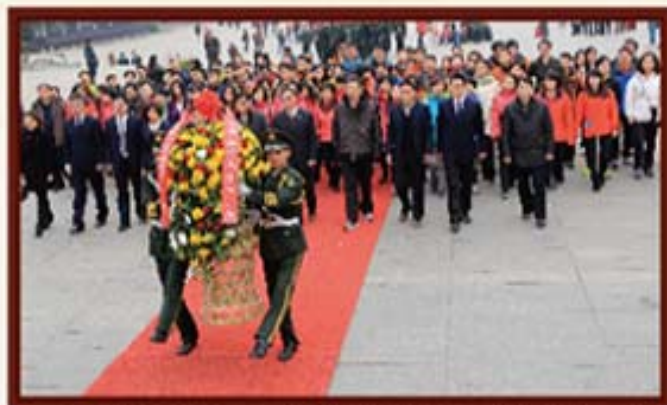
2014年1月3日，湖南信托全体员工赴韶山向毛泽东铜像敬献花篮。