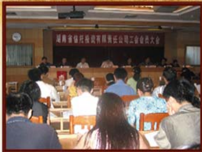
1997年7月14日，湖南信托工会成立。