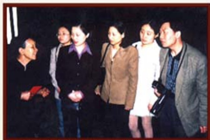
2003年，湖南信托团支部访贫问苦。