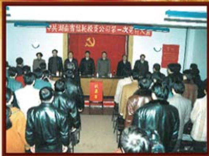
1996年3月27日，湖南信托党委成立。